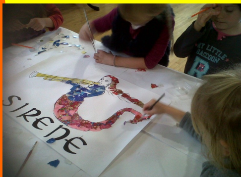
Atelier Bestiaire médiéval