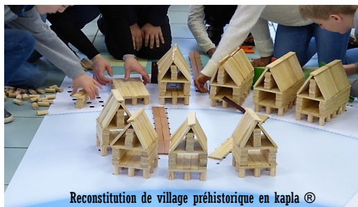
Reconstitution de village préhistorique en kapla®

Nous vous attendons, pour ce moment convivial, de 14 h 00 à 16 h 00.