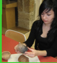
Poterie néolithique

V.G. « Rendez vous aux musées. L'objet du mois : les caramels alimentaires » Apprentissage des techniques de fabrication des céramiques au Néolithique, de leur utilisation en fonction des tailles et des formes. Réalisation d'une poterie.