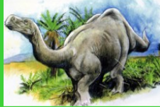
Dessin de platéosaure © Desmond Bovey

Les participants découvrent à quoi ressemblait le Jura et les dinosaures au Trias, au Jurassique et au Crétacé. Création d'une carte Pop-up du paysage à l'époque du platéosaure.