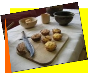
Suggestion de présentation d'une table médiévale