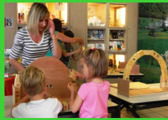
Construction de voûte romane

Comprendre les méthodes de construction de la période, expérimenter le système des forces et des poussées, découvrir les métiers et les outils de la construction au Moyen Âge.