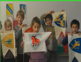
Bannières avec blasons

Sinople ? Meuble ? Gueules ? Sable ? Comprendre le vocabulaire de l'héraldique et les règles de création d'un blason. Découvrons ensemble des armoiries jurassiennes. Réalisation de son propre blason sur divers supports.